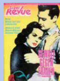
Unser Dokument stammt aus der Ausgabe Juni 1987

Stattdessen haben sich in einigen der halbrunden Wellblechhallen diverse Frickler angesiedelt. Unbeschwert von allzu viel administrativer Kontrolle motzen sie hier gute und bessere Schlitten auf. „Nach im letzten Jahr hätten sie sich einigermäßen gut verstanden mit den Leuten auf dem Platz. Dieses Jahr wäre es aber unerträglich geworden. Das sei der „letzte Abschaum“. Einer der Bastler gerät in Rage, als wir ihn auf Konflikte mit den Roma ansprechen. Solch ein Pack sei ihm noch nicht untergekommen, Untermenschen, mit der Knarre sollte man sie vertreiben, er wäre jedenfalls dabei. Natürlich sei er kein Rassiker, betont er, verweist nochmal auf das letzte Jahr und nennt als gewichtiges Argument für seinen Sinneswandel: „Die klauen doch hier alle und schicken noch ihre Kinder zum Klauen raus. Außerdem scheißen sie uns hier vor die Tür, die Schweine! Und da drüben, da haben sie eine von ihren