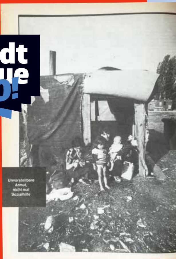
Unvorstellbare Armut, nicht mal Sozialhilfe